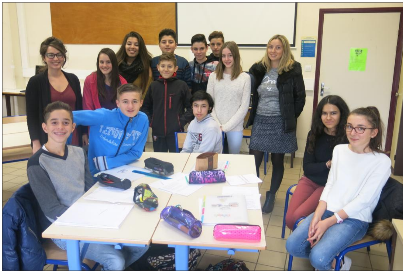
Une partie de la classe médias de 4 e en train de réaliser une revue de presse.

est moins convaincue : « On a une heure de moins de pause, on doit se dépêcher pour manger en une demi-heure. » Aucun élève n'a pourtant exprimé l'envie d'arrêter l'expérimentation : « C'est très intéressant parce que ça sort les élèves d'un travail scolaire. On voit l'émergence de personnalités », selon l'enseignante en français.