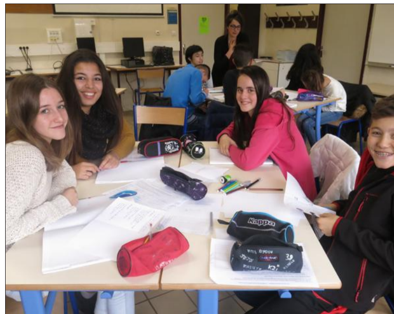
Les élèves travaillent en petit groupe pour élaborer une revue de presse, qu'ils présenteront en classe la semaine suivante.

Les élèves se sont rendus à Paris pour recevoir le prix.