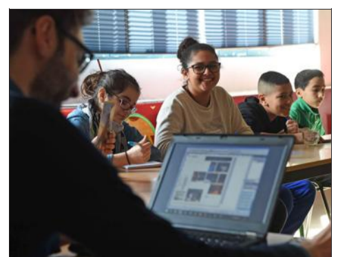
Samedi matin, séance d'écriture au centre social de la vallée de Gère.