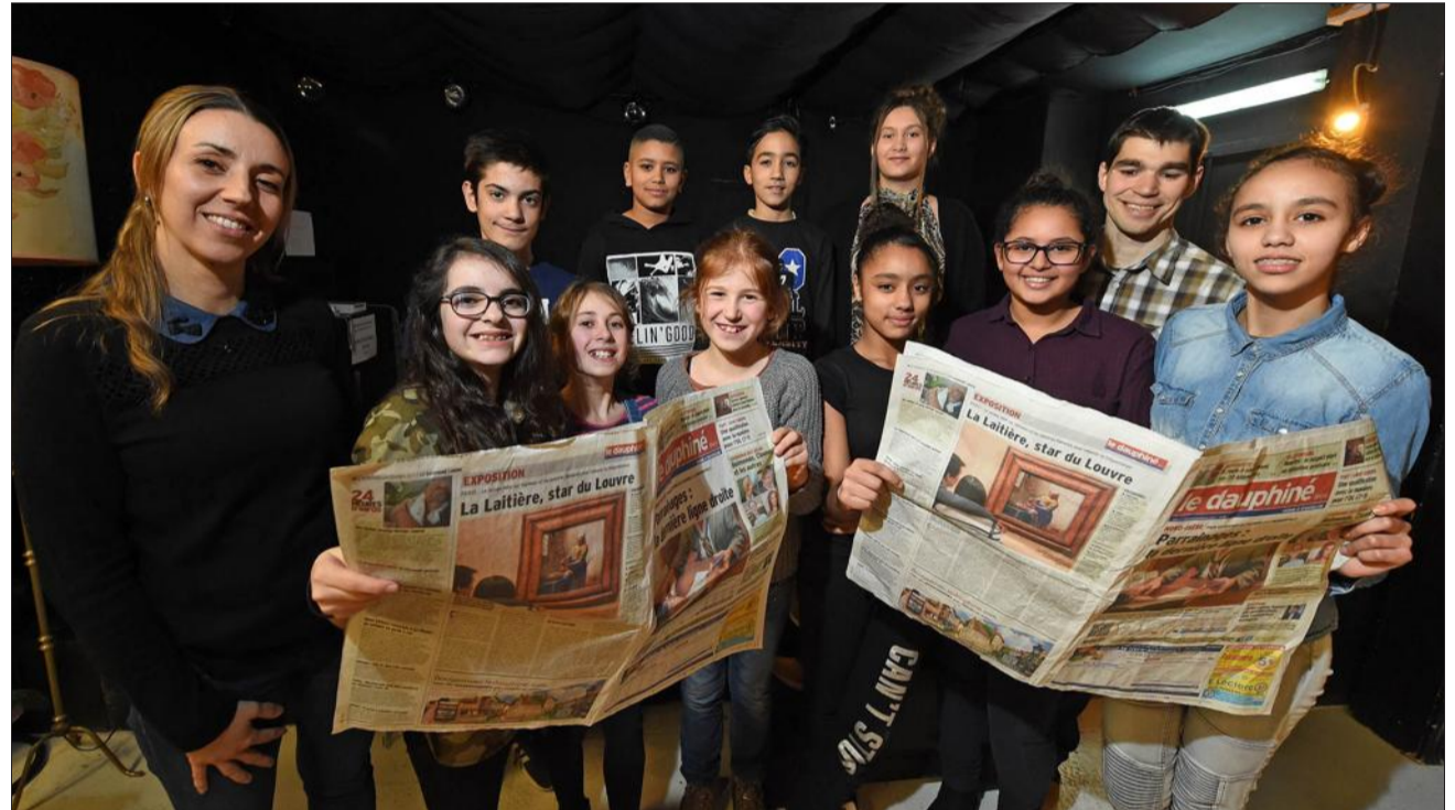
Les enfants de la MJC et du centre social de la vallée de Gère ont travaillé sur un article autour de Jazz à Vienne.