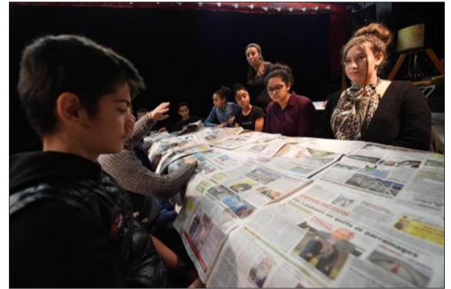
Les enfants ont découvert l'organisation d'un journal.