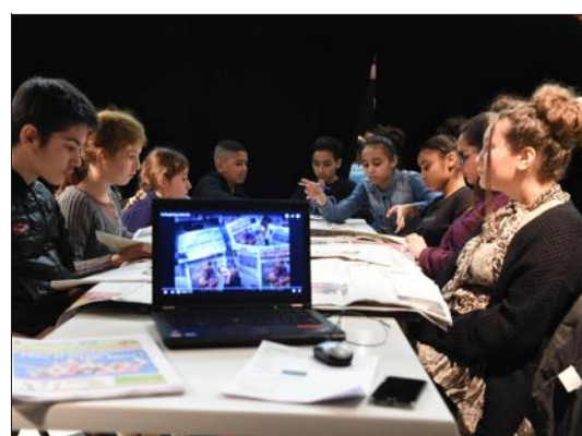
Les enfants ont aussi découvert le site internet du journal.