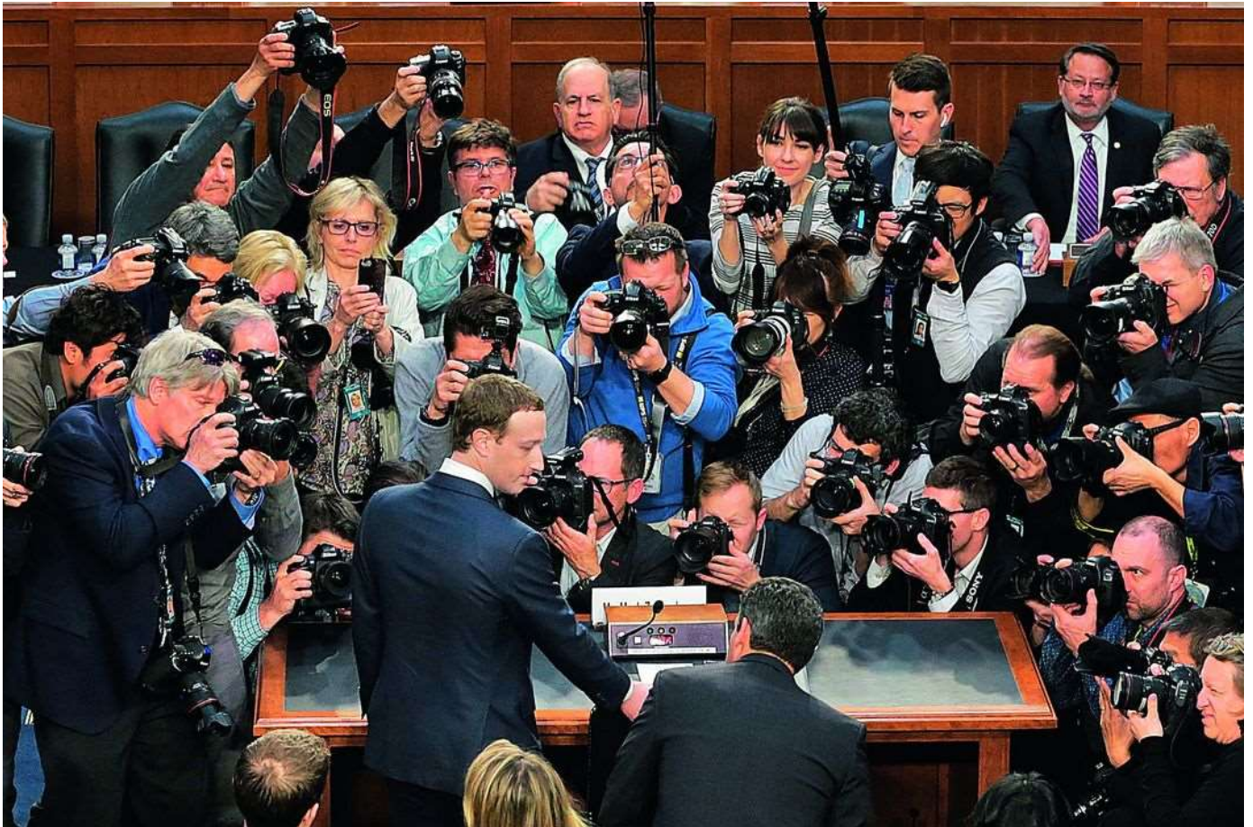
© Belin Éducation/Humensis, 2019 HGGSP Histoire-Géographie Géopolitique Sciences Politique...

Audition de Mark Zuckerberg, fondateur et PDG de Facebook, par le Sénat américain en 2018, dans le cadre de l'enquête sur le scandale Cambridge Analytica (soupçons d'influence sur le vote Trump en 2016).