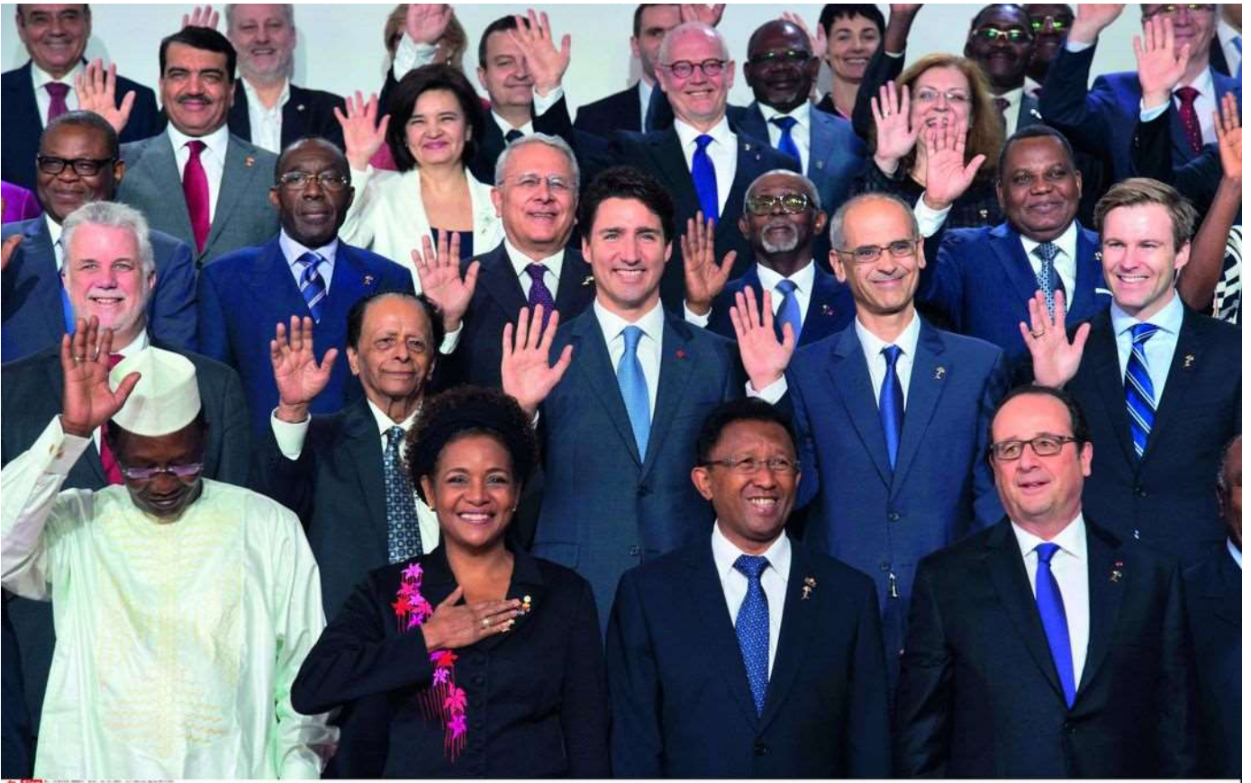
© Belin Éducation/Humensis, 2019 HGGSP Histoire-Géographie Géopolitique Sciences Politique...

Sommet de la francophonie, Madagascar, novembre 2016.