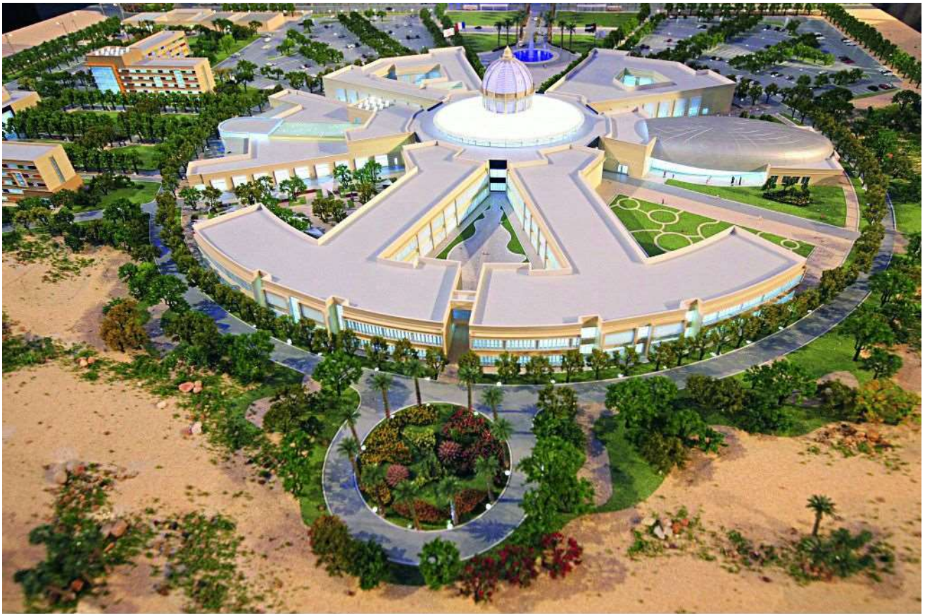
© Belin Éducation/Humensis, 2019 HGGSP Histoire-Géographie Géopolitique Sciences Politiques 1re Spécialité