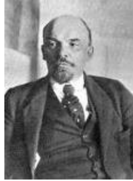
Lénine (1917 – 1924)