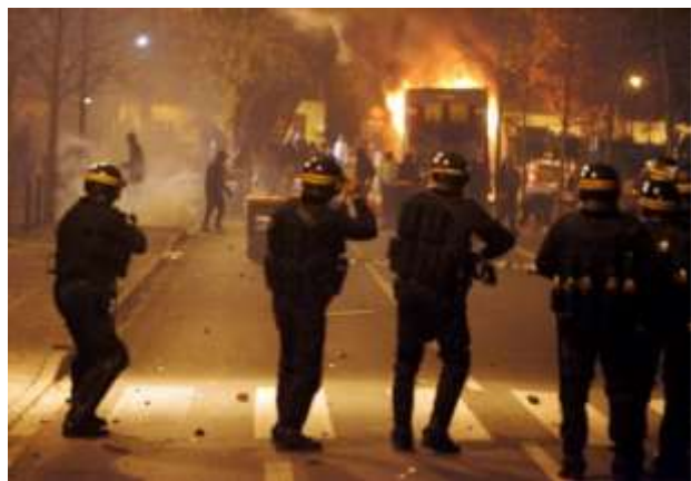
Scène d'émeute dans une banlieue française en 2005.

1 – J'explique pour chacune de ces images, en quoi ces conflits peuvent mettre en danger le lien social. 2 – J'explique ce qu'est l'anomie selon Emile Durkheim. Je propose deux conflits différents ( tirés des documents d'illustration ou de mes connaissances ) qui illustrent la montée de l'anomie. 3 – Quelles images permettraient d'illustrer un dysfonctionnement du système de transmission des valeurs, du politique ou du système d'allocation des ressources.