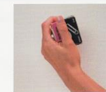
K Boîte trombones secouée