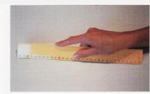
F Règle frottée