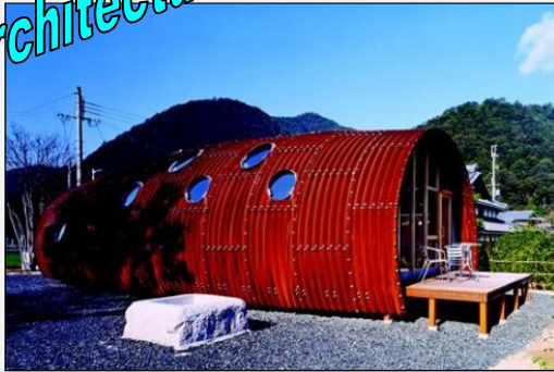
Bâtiment fait de tôles ondulées au Japon