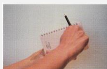
M Spirale frottée avec un crayon