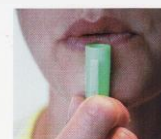
N Capuchon soufflé