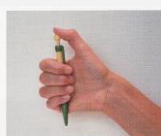
B Poussoir stylo bille