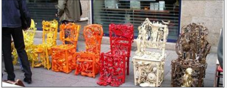
Les belles chaises - exposition à Saint-Nazaire