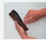
E Fermeture trousse