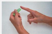
J Capuchon doigté