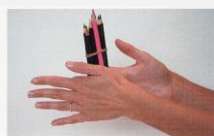
C Crayons de couleurs frottés