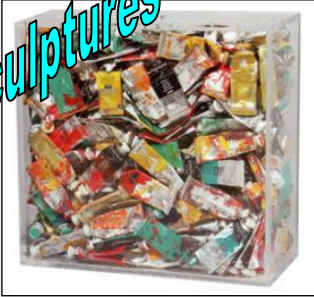
ARMAN - Tubes de peinture