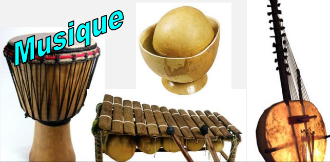
Instruments africains fabriqués à partir de Calebasses, de bois et de peaux de chèvres