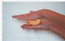
I Papier froissé