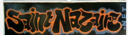
Tags - future cité sanitaire de Saint -Nazaire