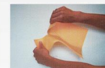
O Papier déchiré

1 : 2 : 3 : 4 : 5 : 6 : 7 : 8 : 9 : 10 : 11 : 12 : 13 : 14 : 15 :