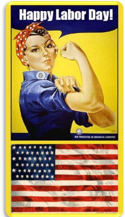
La trousse de Sobelle

Les pique-niques et des barbecues à l'extérieur sont une activité préférée ce jour-là.