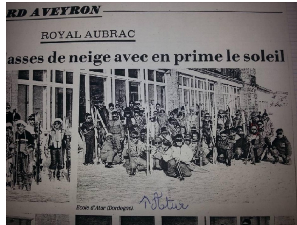
L'école d'Atur au Royal Aubrac

La bonne ambiance commençait dans le bus et se prolongeait toute la semaine. « Nous partagions la semaine entre travail scolaire et cours de ski, et le soir c'était détente tous ensemble, jeux de société et même boum ! » De plus ça permettait à des jeunes qui ne partaient pas en vacances à la neige de découvrir la montagne.