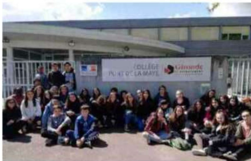
Les collégiens des deux pays associés dans un programme européen.