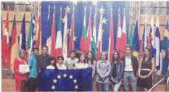
La remise des prix à Strasbourg.

Dans le cadre d'un échange culturel avec trois établissements scolaires italiens de Pesaro, les élèves qui étudient l'italien au collège Point-de-la-Maye ont réalisé un audioguide interactif et plurilingue des régions de leurs correspondants.