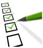
Tableau indiquant les critères d'évaluation de la construction d'un tableau

Remarque : choisir de représenter les informations en ligne ou en colonne n'a pas d'importance. Les 2 tableaux ci-dessus sont donc identiques. Il faut simplement adapter au mieux sa mise en page.