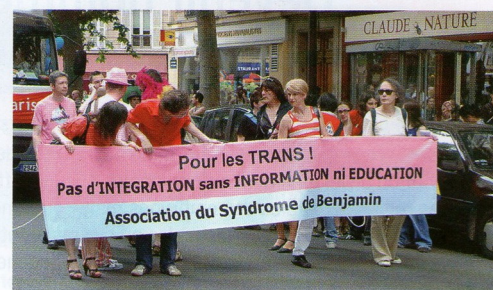
Manifestation de transsexuels à Paris

Les transsexuels sont des personnes qui estiment que leur identité sexuelle ne correspond pas à leur genre biologique. On parle de transsexuel masculin pour un homme qui se sent femme et de transsexuel féminin pour une femme qui