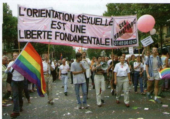
Gay-pride : marche contre les discriminations

L'orientation sexuelle se révèle le plus souvent au