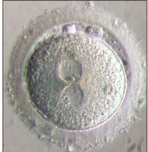
Doc.2 : Figure de fécondation chez un Mammifère (microscope optique)