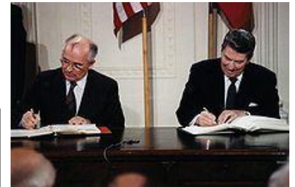
Diell 3: Gorbatchev ha R. Reagan e 1987 é siniñ an emglev dizarmiñ

Diell 2: staliñ a reas URSS misilioù pennoù nukleel, an SS20 staliet e Reter Europa a-dal 1977. Staliñ a reas ivez an Amerikaned fuc'helloù Pershing II e Europa gornôgel a-dal 1983.