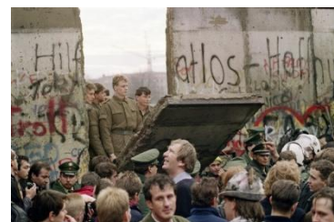
Diell 5: Distrujet eo moger Berlin d'an 9/11/1989