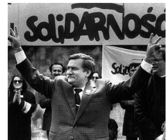
Diell 4: Lech Walesa e Polonia, krouer ar sindikad Solidarnosc

2. Pet a Stadoù a yeas da zigenstrolliñ an URSS? Diell 6