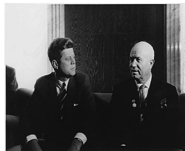
Kennedy ha Khrouchtchev, Wien, 1961

1965: feur-emglev àr eneplediñ an armoù nukleel