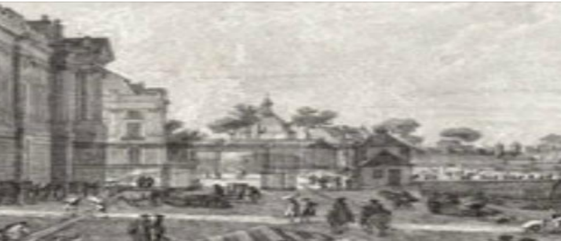
Talbennoù nevez en XVIIIvet k.