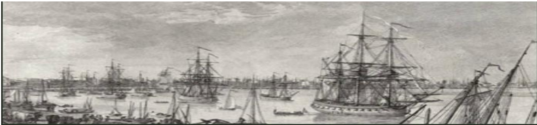
Batimantoù kenwerzh eoriet é c'hortoz ar gourlanv