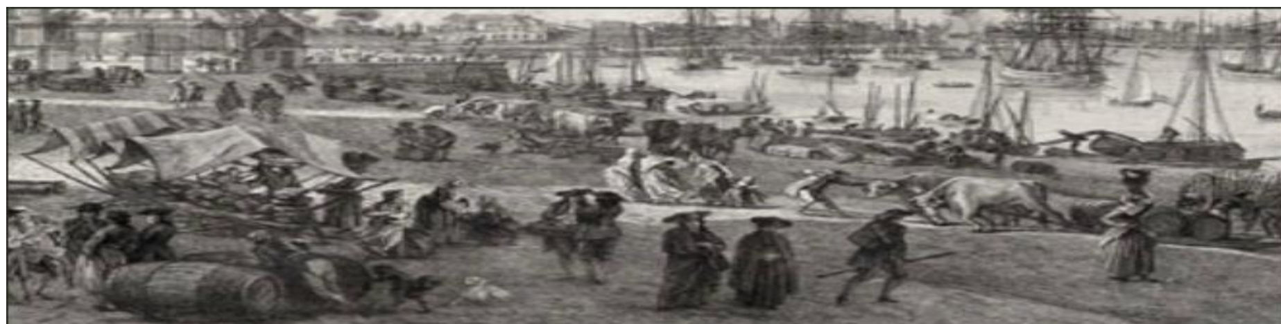
Ejoned é sachiñ barrikennoù gwinn