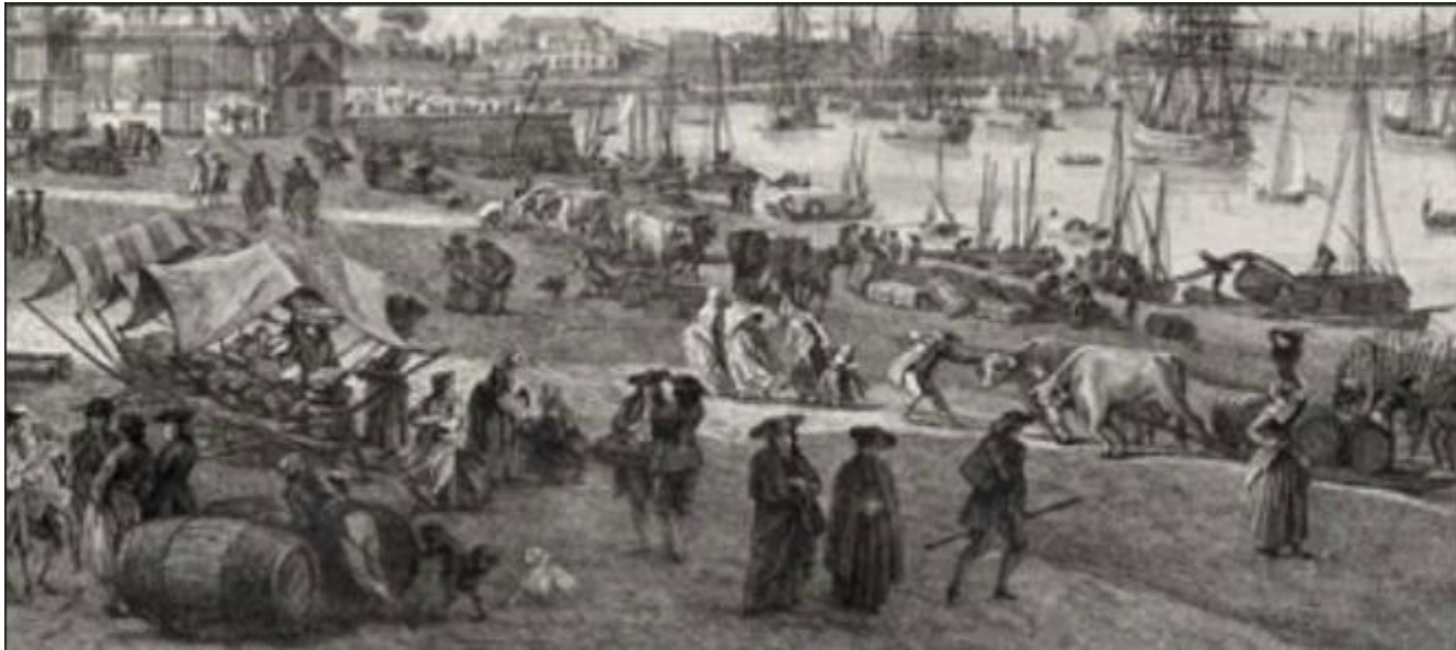
Talbennoù ar savadurioù savet àr ribl kae ar Salinières en XVIIIvet kantved