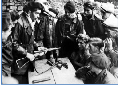
Diell 5: ar strouezheg e Vercors