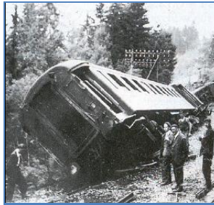
Diell 3: tarverezh un tren e Saône-et-Loire, meurzh 1944