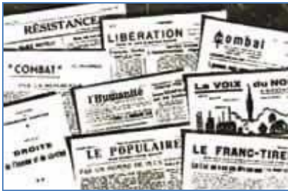
Diell 2; kazetennoù kuzh dispaket