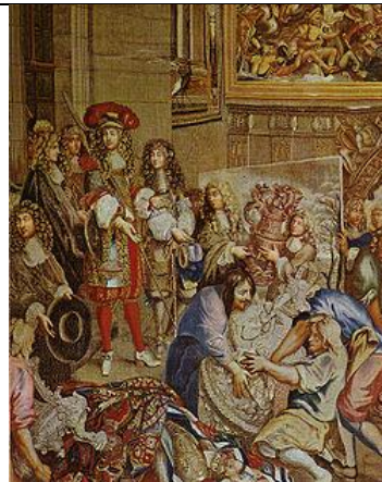
Ar roue é welladenniñ manufaktur ar Gobelined a sav pallennoù get Colbert e 1667

Krouet e voe Manufakturioù ( ur savadur hag a strolle degadoù a vicherourien hag a laboure get benvegoù plaen) roueel : sachiñ a rae embregererien estren en ur roiñ dezhe dreistwiriou