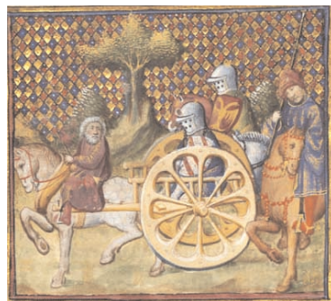
Lancelot-Graal, enluminé par le Maître des Cleres Femmes, entre 1404 et 1465, Paris

H - « J'ai été choisi pour aller chercher le Graal car je suis le chevalier parfait, le chevalier pur, à la différence de mon père... Je serai le seul à pouvoir m'asseoir sur le Siège périlleux de la Table ronde et je verrai le Graal. Qui suis-je ? »