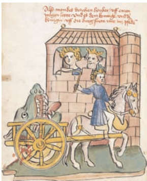
Tristan de Gottfried de Strasbourg, vers 1486