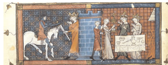
3 Conte du Graal et continuations, Chrétien de Troyes, 2e quart du XIVe siècle, Paris