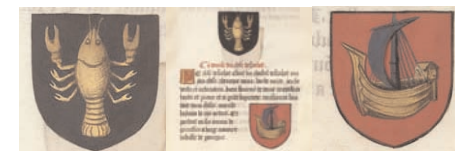
Blason de la table ronde

Crée ton propre blason. N'oublie pas qu'au centre du blason, le dessin doit rappeler ton surnom ou l'un de tes exploits !