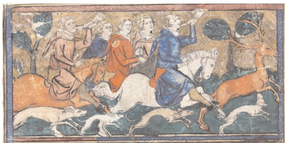
4 Petit Artus de Bretagne, enluminé par le Maître de Fauvel, 1 er tiers du XIV e s, Paris