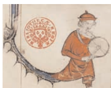
Petit Artus de Bretagne, enluminé par le Maître de Fauvel, 1er tiers XIVe s., Paris, Détail