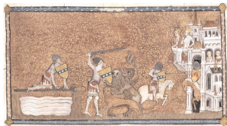
5 Lancelot-Graal, 1344, Tournai

B - Pourquoi Lancelot se met-il en danger ? Quelle énergie le pousse à affronter ces épreuves ?