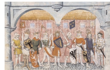
Le chevalier errant, Thomas de Saluces